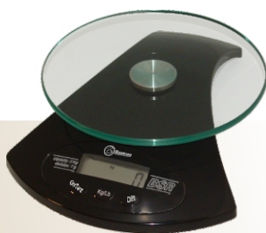
Version en noir.