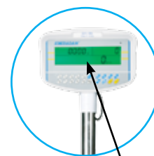
Ecran lumineux rétro-éclairé